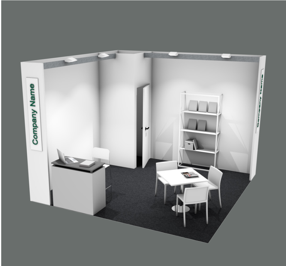
Soluzione 2 lati aperti / Two open sides booth